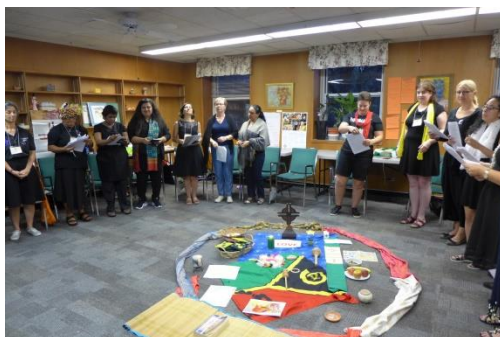
2019 Réunion du Comité Exécutif de la JMP

Les prières du matin nous invitaient à réfléchir sur le thème de la JMP Zimbabwe « Lève-toi, prends ton grabat et marche ». Chaque jour, un point de vue, un accent, ou une expérience ont été partagés à travers une vue d'ensemble de la Bible, ainsi que la célébration du service religieux. L'offrande collectée auprès du Comité Exécutif lors de la célébration a été dédiée au comité JMP Zimbabwe.