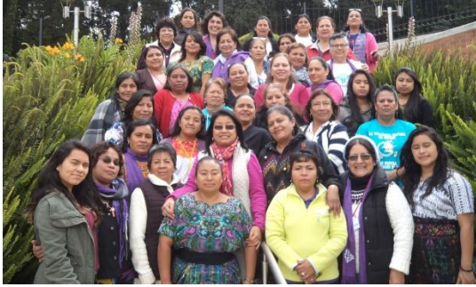
2017 SNC Costa Rica, Guatemala, El Salvador

femmes défendant, à travers la prière et l'action, les problèmes sociaux et environnementaux. En cartographiant les régions de la JMP, nous avons mis l'accent sur des soucis critiques discernés dans le mouvement comme : une direction dysfonctionnelle ou non intergénérationnelle, des idées fixes et des pratiques rigides, des difficultés à accéder aux nouvelles technologies, un déclin des ressources financières, des styles de célébrations répétitives et un déséquilibre entre les prières et les initiatives d'action. Cependant, nous avons également reconnu que la JMP apporte au monde un espace pour une participation intergénérationnelle, une prière en tant qu'exercice d'écoute et d'action, une conscience des problèmes sociaux et un plaidoyer pour la paix, pour prendre soin de notre environnement, pour les droits de la femme et une vie libre de violence.